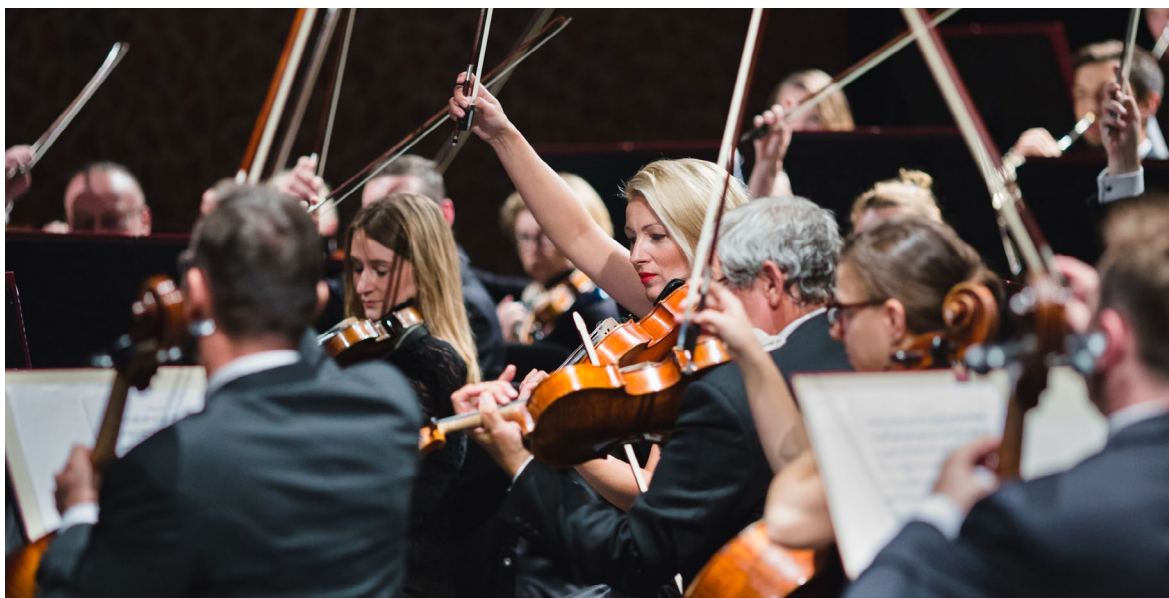
Inauguracja 41. sezonu artystycznego (2019)