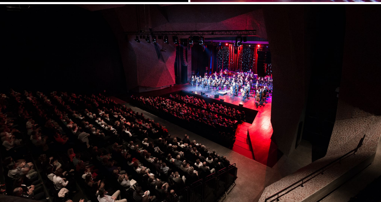
Od La Scali do Broadway'u (2017)