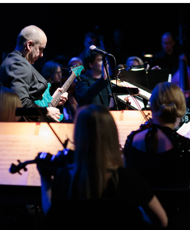
Dire Straits symfonicznie (2017)