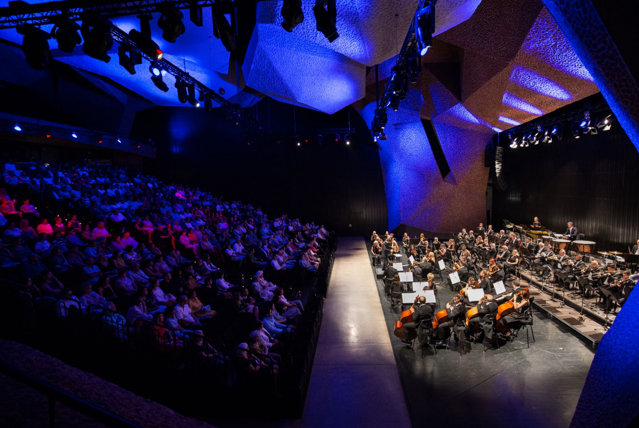
23. Międzynarodowy Festiwal „Nova Muzyka i Architektura” (2019)