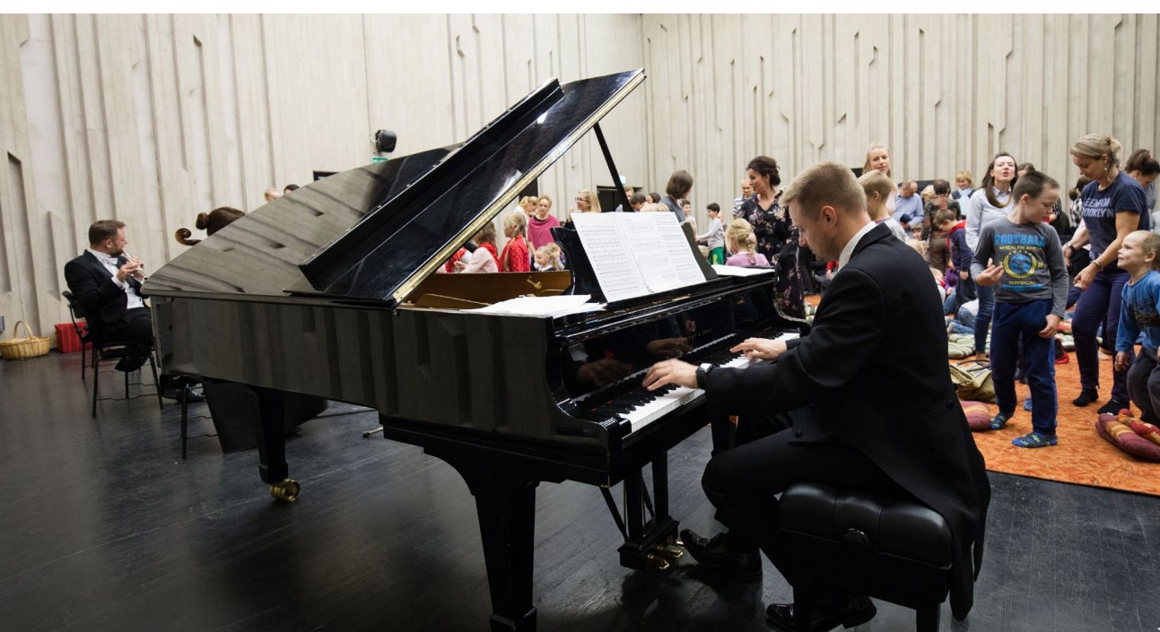
Festiwal Sity Natury – Ziemia Planety Gwiazdy (2017)