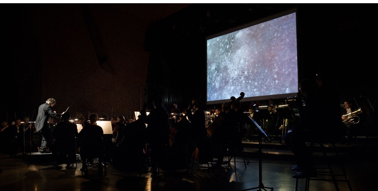
Festiwal Sity Natury – Ziemia Planety Gwiazdy (2017) – Muzyka i multimedia