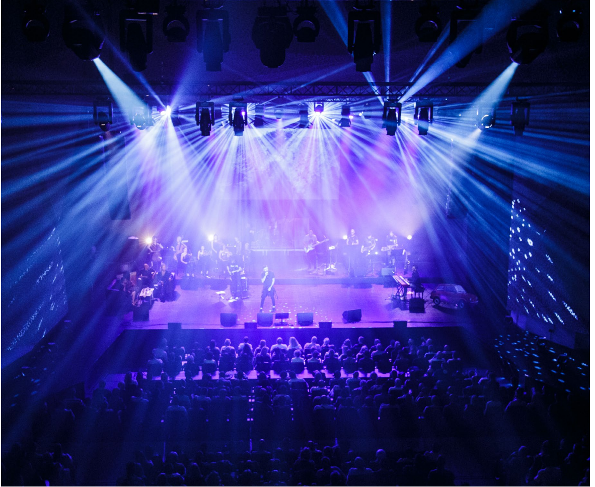
Symphonica – Rock of Poland (2018)