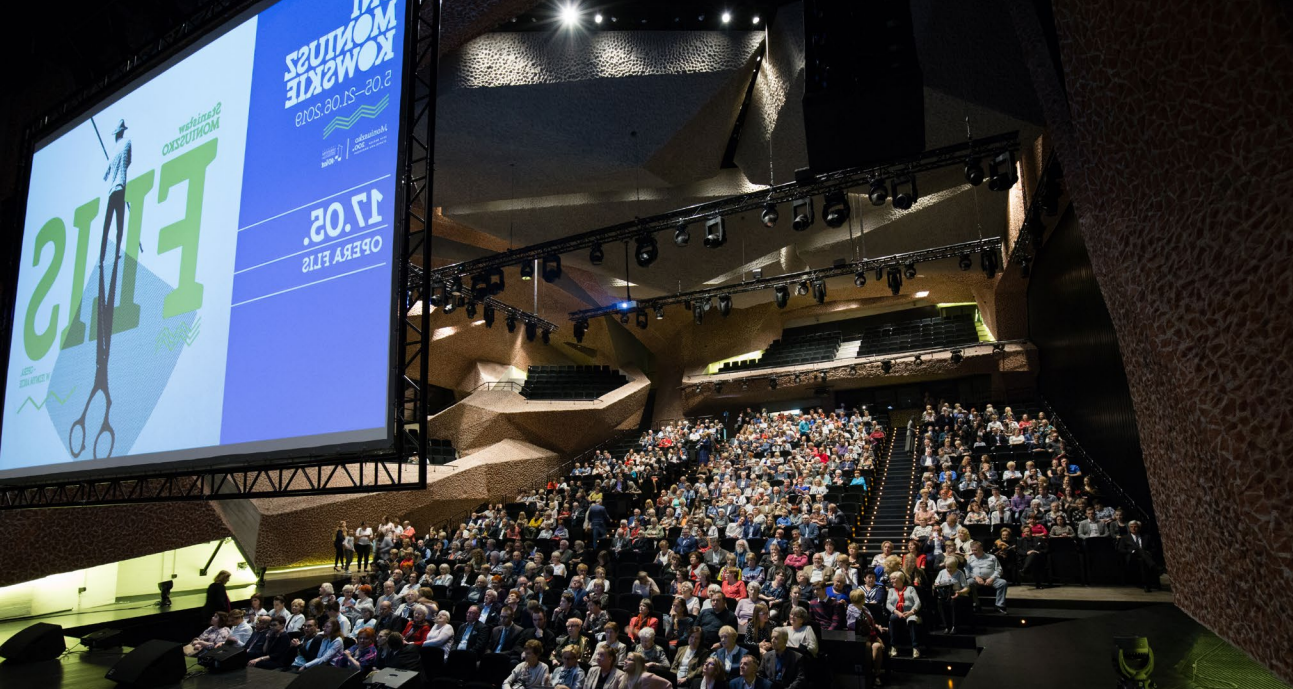
Dni Moniuszkowskie – Opera Flis (2019)